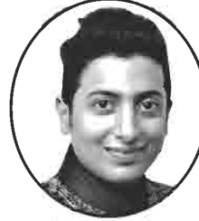
મિહીર બિના વેલજી ખેશજ ગડા સામખીચારી-ચર્નિરોડ