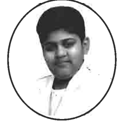
ચૈત્ય હિના અનીલ પ્રેમજી સાવલા મનફરા-દર્દીસર